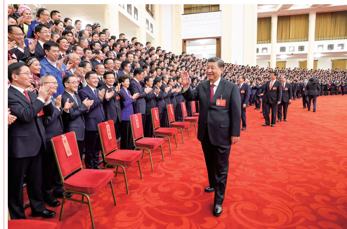
10月23日下午,中共中央总书记、国家主席、中央军委主席习近平等领导同志在北京人民大会堂亲切会见出席党的二十大代表、特邀代表和列席人员,并同大家合影留念。

新华社北京10月23日电 中共中央总书记、国家主席、中央军委主席习近平23日下午在人民大会堂亲切会见了出席党的二十大代表、特邀代表和列席人员,并同大家合影留念。