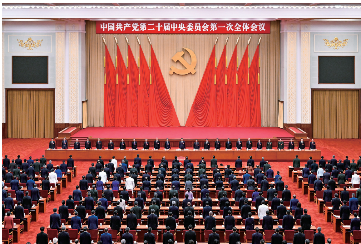
左图:10月23日,中国共产党第二十届中央委员会第一次全体会议在北京人民大会堂举行。习近平同志主持会议并在当选中共中央委员会总书记后作重要讲话。