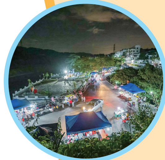
根子镇元坝桥头村夜市就设在碧道旁。