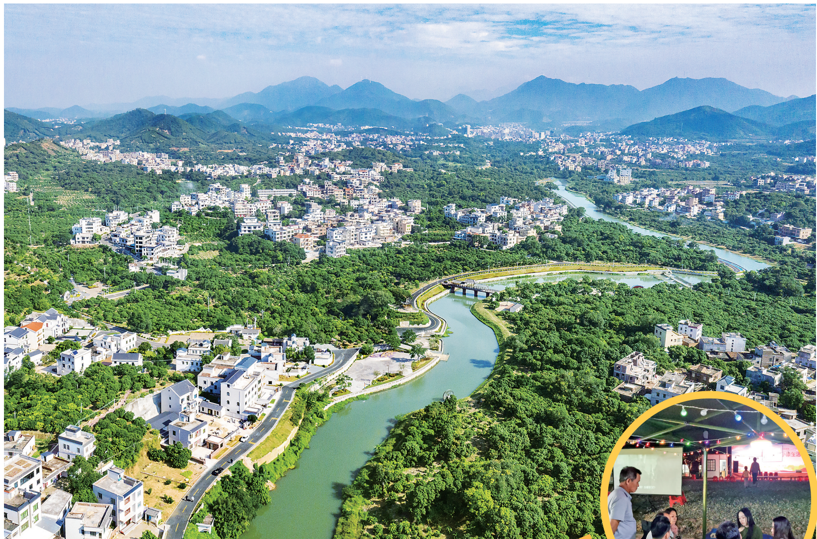
高州根子河碧道大大改善了当地的生态环境。

打造绿色水经济新业态是省委、省政府贯彻落实习近平生态文明思想作出的决策部署，是践行“绿水青山就是金山银山”的广东实践。茂名近年来做好、做足、做活“水文章”，把河湖优质生态产品价值转化成“水经济”，在推动经济社会高质量发展上交出了一份靓丽的民生答卷。