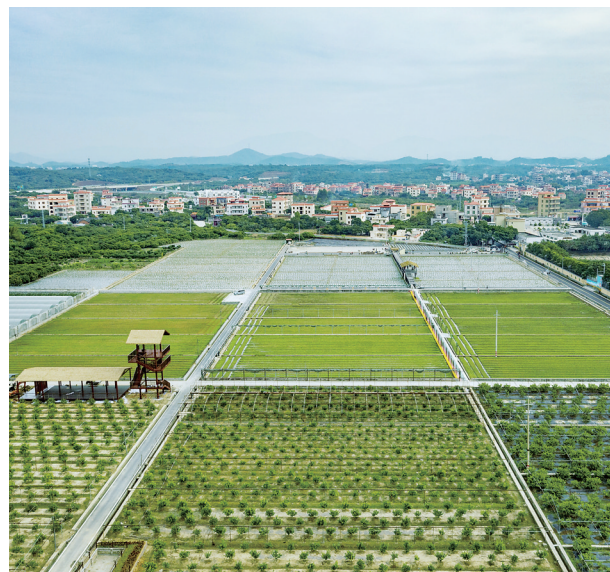
高州分界镇储良杏花村碧道旁建起了观光农业。

这些碧道的建设不仅是茂名河湖治理取得成效的反映，更是茂名构建“河清岸绿、鱼翔浅底、水草丰美、白鹭成群”的岭南水乡画卷的缩影，带动了美丽乡村建设，促进了“水经济”发展，增强了民众获得感、幸福感和安全感。