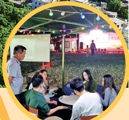
茂名“精彩100里”碧道旁的山阁镇那际村夜市，年轻人在夜市小聚。茂名日报社全媒体记者 岑稳 摄