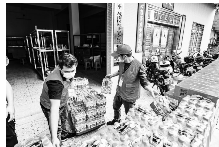
爱心企业捐赠疫情防控物资。