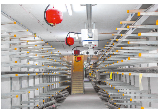
肇庆新区地下综合管廊运用机器人进行检测情况。