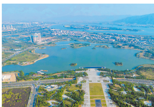
肇庆新区的砚阳湖公园如一方砚嵌在岭南大地上，充分彰显肇庆独特的历史文化气息。