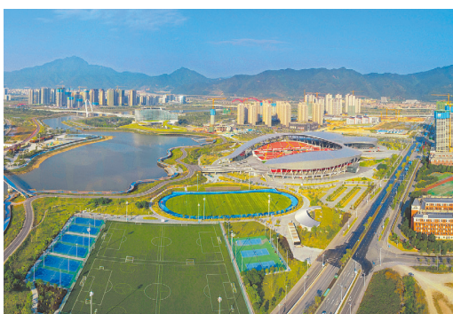
体育中心是肇庆新区的新地标。是2018年第十五届省运会开、闭幕式的主场馆。