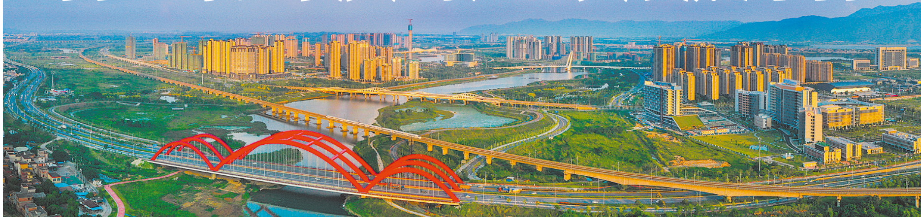
十年间肇庆新区从滩涂鱼塘到高楼林立，城市面貌实现完美蝶变。