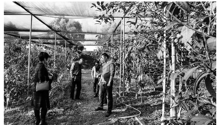
电白黄岭镇基地以金花茶种植为媒,打造生态旅游发展规划。