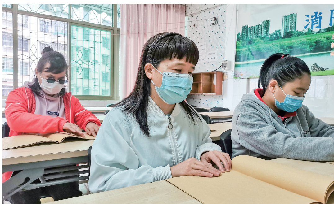
▲视障者正在进行盲文阅读。

我们通过眼睛看到世界，如果换个方式，用触摸去感知，世界会是什么样的呢？2023年1月4日是第五个世界盲文日，茂名市爱心残疾人职业培训学校举行国家通用盲文阅读活动，视障者共同交流盲文，分享学习快乐。