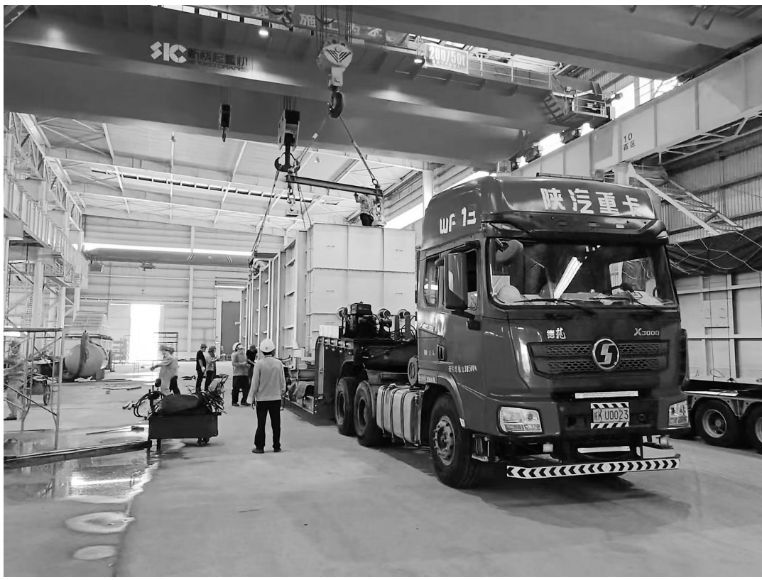
我市制造业企业自主创新产品频频出厂。

我市狠抓平台载体建设,全力打造高水平创新平台。首先是全力推动茂名高新区提质建设。2022年省科技创新战略专项(“大专项+任务清单”)专门设立高新区高质量发展专项。其次是加快推动茂名绿色化工研究院建设。推动茂名绿色化工研究院与众和、新华粤、实华等龙头企业合作,开展揭榜挂帅