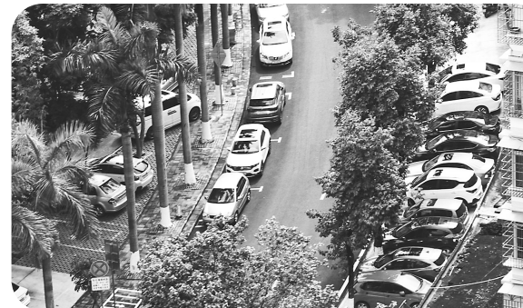
荔红等11个老旧小区进行改造提升,进一步完善了小区道路、排水、绿化、停车位等公共基础设施。本报记者 黄信涛 摄

2022年,茂名市针对2000年以前建成的、年代较早、失修失管、市政配套设施不完善、社区服务设施不健全、影响居民基本生活的小区,根据民意和实际情况进行改造。过去一年来,茂名对祥和、荔红等11个老旧小区进行改造提升,进一步完善了小区道路、排水、绿化、停车位等公共基础设施,惠及1.2万多户居民群众,全方位提升居住生活品质。据社区居委反馈,居民满意度超90%。2022年的91个老旧小区改造升级工作已全面启动,各县区均已动工建设。