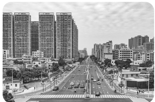
断头路高凉南路开通。本报记者 丘立贺 摄

“断头路”是阻碍城市发展堵点、难点、痛点问题。2022年茂名市十件民生实事中,打通“断头路”任务有3条。目前,高凉南路、金宝小区街坊路已建成通车,新兴六街已完工,保养期过后即可通车。同时,纳入2022年茂名市十件民生实事的10座危桥已全部拆除重建并通车,另超额完成6座危桥改造任务。