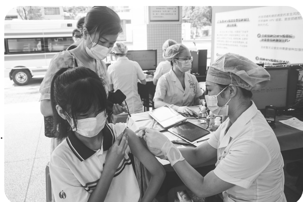
女生免费接种疫苗。

宫颈癌可防可控,接种HPV疫苗是预防的有效手段。2022年9月14日,茂名市启动适龄女生HPV疫苗免费接种项目。2022—2023学年度茂名市初一女生逾5.2万名,按照知情、自愿、免费的原则,茂名已为5.05万名新进初一女生免费接种HPV疫苗,超额完成任务。茂名初一女生和家长宫颈癌防控知识(含疫苗接种)知晓率分别达到92.54%和92.77%。