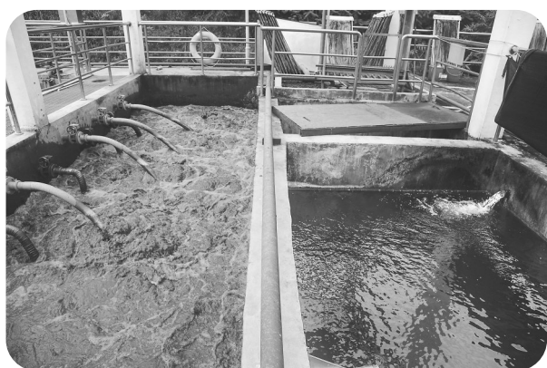
信宜市思贺镇水质净化厂。

人口超过800万的茂名市,农村户籍人口占比近六成。生活污水治理基础薄弱、治理任务艰巨,是农村人居环境整治提升的突出短板,也是难点。2022年茂名把实施农村生活污水治理攻坚行动作为十件民生实事之一,成立了以市长为组长的农村生活污水治理攻坚领导小组,推进茂名农村生活污水治理工作。目前,茂名市已累计完成8108条自然村生活污水治理,纳入2022年茂名市十件民生实事的100条自然村污水治理项目已超额完成任务。