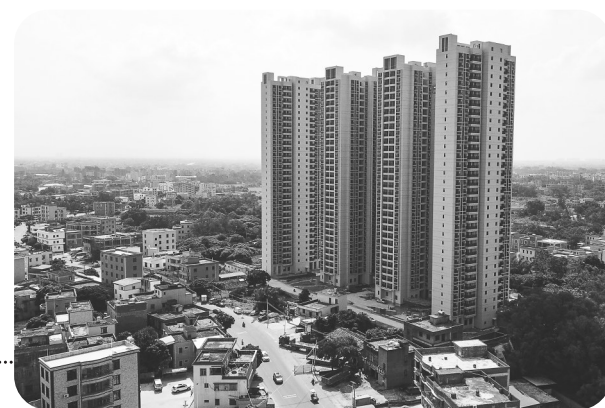
图为茂南区羊角镇棚户区改造项目。

安居乃民生之要,安居才能安心。2022年茂名市已发放租赁补贴1400户,完成率达148%;新开工建设棚改住房384套,已全面开工建设;已基本建成744套棚改住房并竣工验收,完成率达105%。