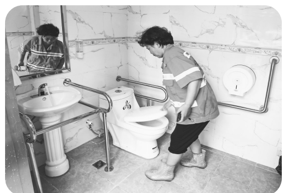
图为江东中路公厕设置的安全扶手等无障碍设施。

无障碍环境建设,是城市精神文明建设的窗口。过去一年来,茂名按照“一户一案”或“一人一案”原则,因人因地制定方案。2022年茂名共完成791户改造任务,完成率达226%。同时,为1173户困难残疾人家庭进行无障碍改造,完成率达117%,并且提前完成1500名残疾人基本辅具适配服务。