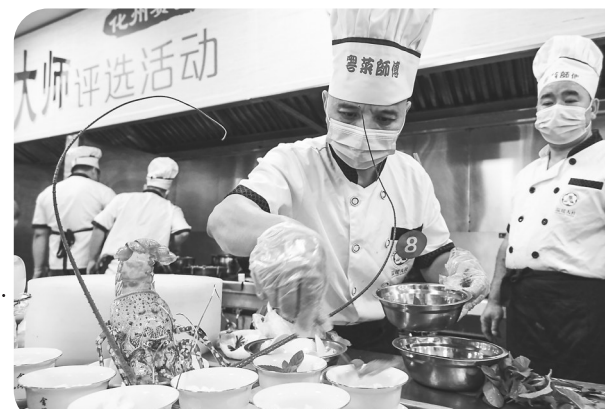
持续推进“粤菜师傅”“广东技工”“南粤家政”三项工程。

以美食为媒,以技能为根,以服务为本,茂名市持续推进“粤菜师傅”“广东技工”“南粤家政”三项工程,全力打造改善民生茂名招牌,助力乡村振兴。截至2022年11月底,累计开展“粤菜师傅”培训6219人次,完成率达124.4%;累计开展“广东技工”补贴性职业技能培训22463人次,完成率达112.3%;累计开展“南粤家政”培训6990人次,完成率116.5%。