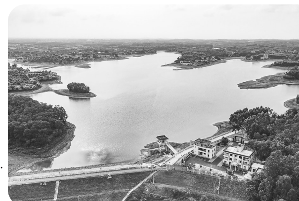
图为加固后的茂南区青年湖水库。

过去一年,茂名市政府持续实施小型病险水库除险加固工程,及时消除水库安全隐患。2022年茂名共实施小型病险水库除险加固工程27个,其中纳入茂名市十件民生实事的5个项目均已完成主体工程建设。拧紧防汛除险“安全锁”,消除水库安全隐患。