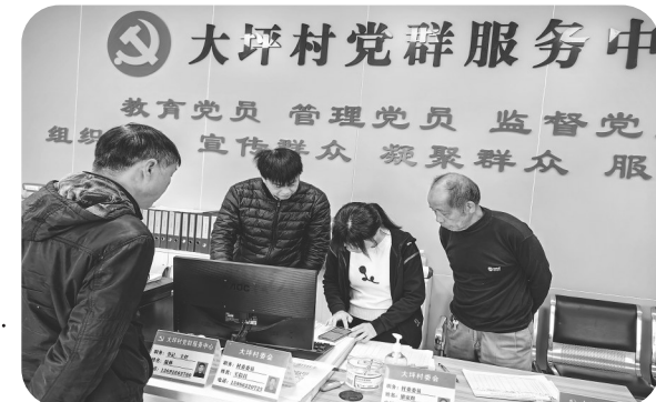
思贺镇大坪村耐心为群众核实低保缴纳情况。

双百社工以服务基层困难群众和特殊群体为主要服务对象,双百工程事关提升民生福祉与社会建设水平。2022年,茂名市已建成112个镇(街道)社工服务站,持续建设约379个村(居)社工服务点,聘用社工总人数1827人,实现茂名市乡镇(街道)社会工作服务站(点)及困难群众和特殊群体社会工作服务两个100%覆盖,打通为民服务“最后一米”,社会救助兜底保障更加深入,更有温度。