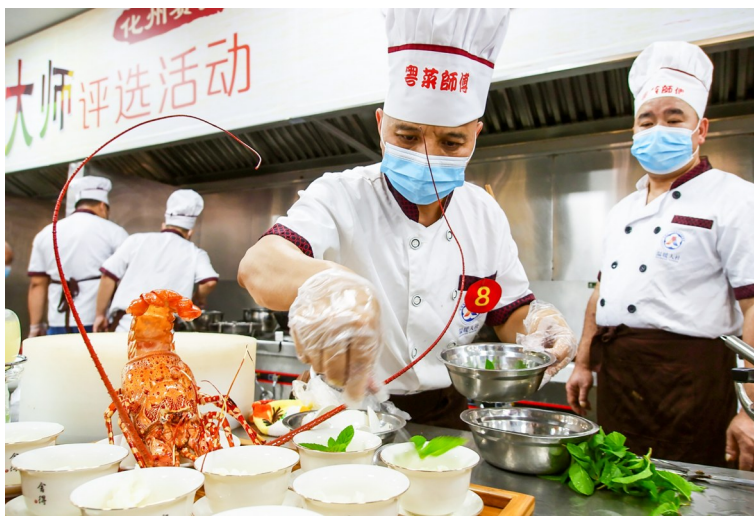
我市高质量推进“粤菜师傅”等三项工程。

报告中提出“实施就业优先战略”。众所周知,民生内容随着经济发展和进步而不断拓展,但最大、最基本的民生是就业。2022年6月,习近平总书记到四川宜宾学院实地考察高校毕业生就业工作时强调,“党中央十分关心民生工作,