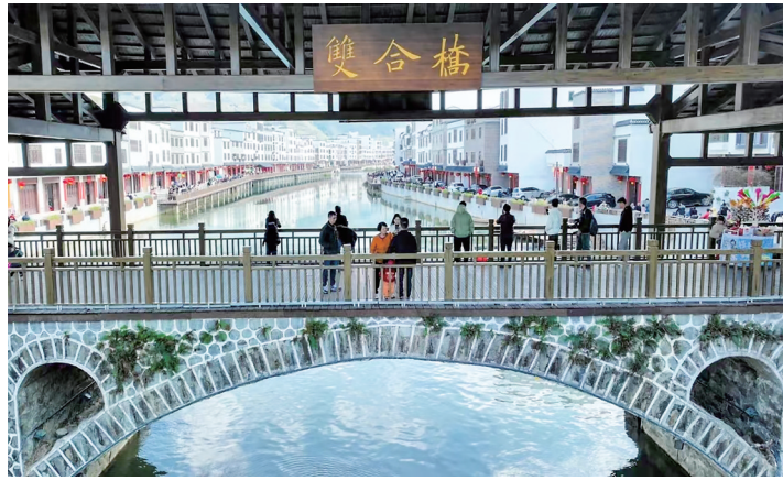
信宜市钱排镇“山水双合”景区。 资料图

以文塑旅、以旅彰文,是保持旅游景点活起来火起来长久下去的重要手段,缺乏文化内涵的旅游地空洞无味,没有生命力。坚持以文塑旅、以旅彰文,推动“四游联动”,是对游客游玩产品供给的进一步丰富,通过深入挖掘资源、利用资源,打响“山海并茂、好心闻名”旅游品牌,打造更多定位精准、品类丰富、来了还想再来的文旅休闲旅游地,将进一步促进旅游业高质量发展。