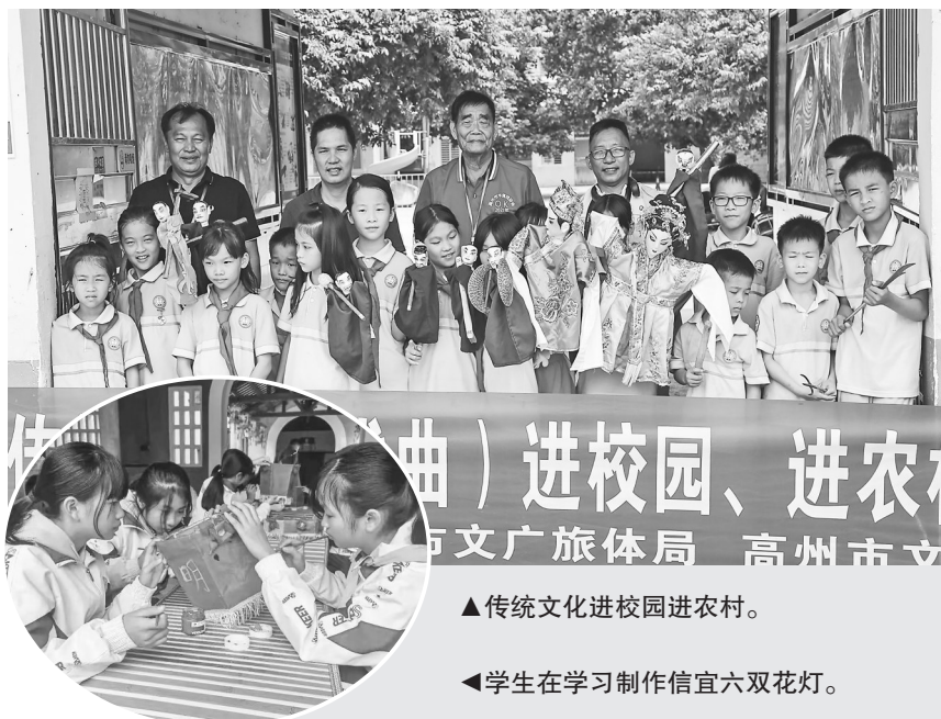
▲传统文化进校园进农村。