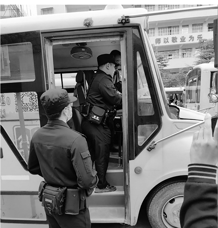
▶联合工作组对幼儿园校车开展安全检查。

通过本轮安全检查及宣传工作,该镇进一步提升了学校安全防范水平,强化了各部门的责任感,发现了存在的隐患疏漏。下一步,该镇将继续完善多部门联动的工作机制,持续加强对辖区内的各类学校的管理力度,不断筑牢学校安全防线,确保孩子们身心健康成长。