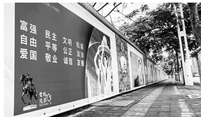
大街小巷可见公益广告。

开展督导检查,对各部门履行职责、推进工作、完成任务的情况,进行高密度、多轮次的督查考核,加大曝光力度,开展明察暗访,定期通报进展情况,持续做好创建全国文明城市实地考察点位建设工作,谋划推进创建全国文明城市“十大攻坚工程”,重点解决群众关心的民生实事,完善城市基础设施,打造文明宜居的城市环境,提升创建水平。发挥新时代文明实践所、站阵地作用,把握每月有影响的节假日、纪念日等重要时间节点,广泛开展丰富多彩的文明实践