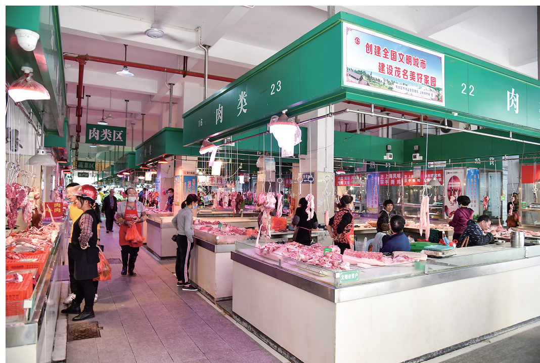
电白区上排坝市场功能分区合理,干净整洁。

2023年,电白区将以全面贯彻落实党的二十大精神为契机,进一步加强科学统筹,强化工作措施,持之以