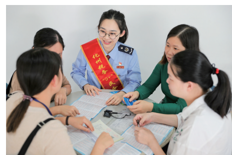
工作人员开展税费政策宣传。 光。该税务分局先后获“全国青年文明号”“全国职工模范小家”“一星级全国青年文明号”等荣誉称号。

2023年,广东省委宣传部命名第九批广东省学雷锋活动示范点和岗位学雷锋标兵。国家税务总局化州市税务局鉴江税务分局入选第九批广东省学雷锋活动示范点。榜样的力量是无穷的,以时代楷模为榜样,向先进典型看齐,就能汇聚起磅礴的正能量。一直以来,国家税务总局化州市税务局鉴江税务分局坚持“天天学雷锋,日日做实事”,一批又一批税务干部深扎基层,想群众之所想,急群众之所急,用心用情办好群众大小事,让雷锋精神在税徽上闪闪发