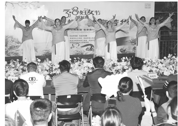
站前街道社工表演舞蹈《不忘初心》。

她在最平凡的岗位切换着不同的角色,连续两年被评为项目先进工作者,是拌合站当之无愧的“多面女王”。