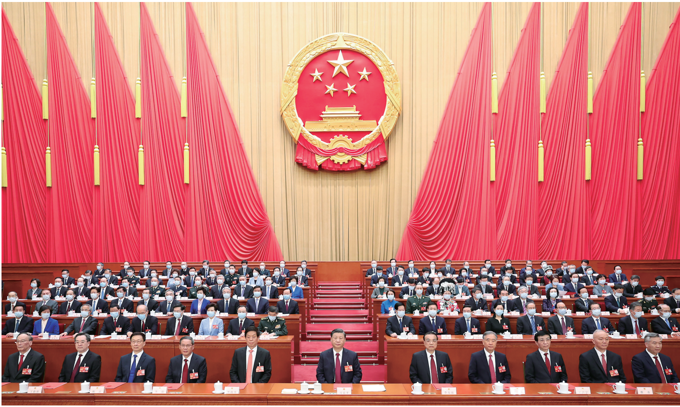
3月13日,十四届全国人民代表大会第一次会议在北京人民大会堂闭幕。习近平等党和国家领导人在主席台就座。