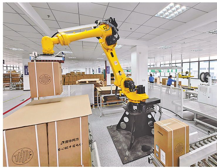
计算机生产线包装区自动高速码垛机器人。