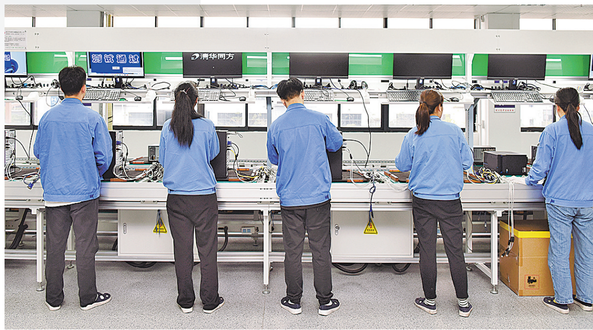
清华同方玉林生产基地计算机终检区。