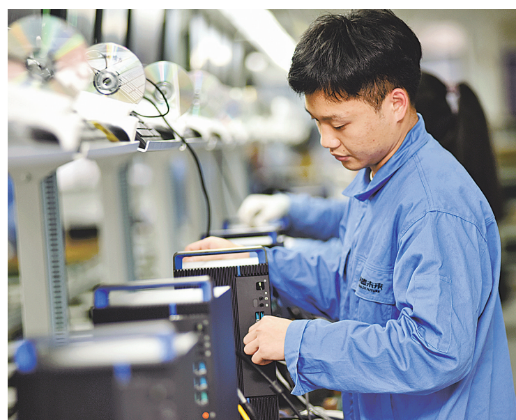
生产线上的计算机正在做出厂前最后的检测。