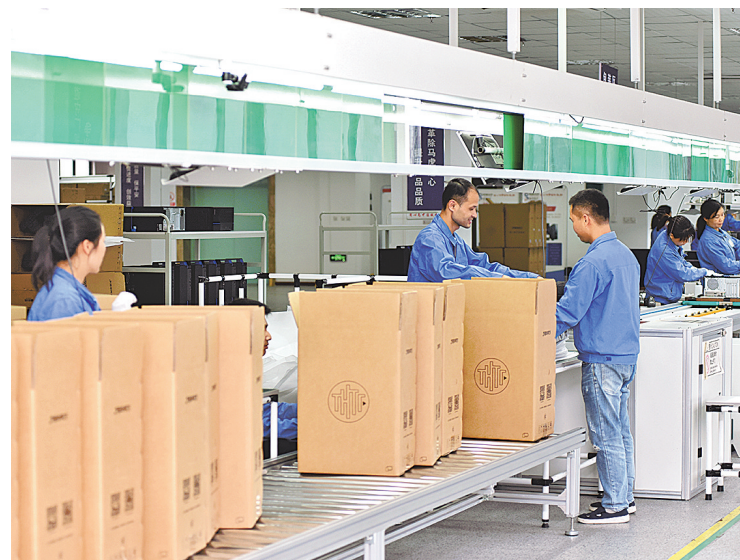
清华同方玉林生产基地生产线包装区。