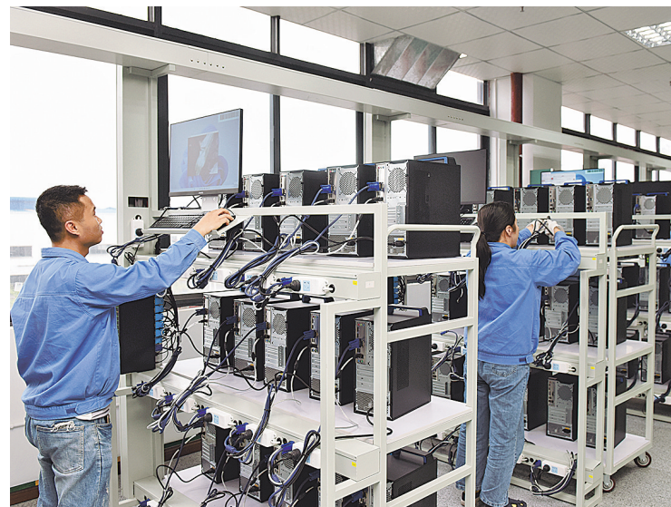
计算机老化测试车间。