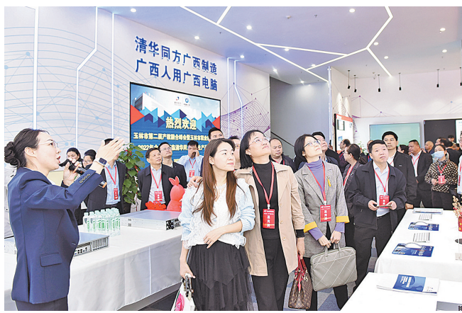
嘉宾考察位于广西先进装备制造城(玉林)的清华同方玉林生产基地。