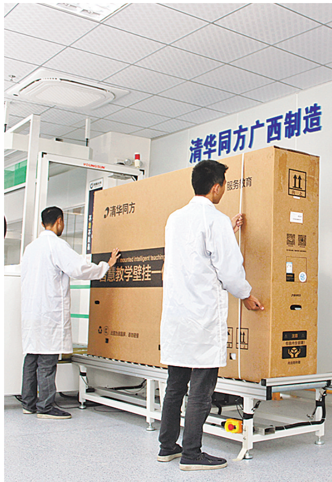
清华同方智慧大屏生产线包装区。

走进同方计算机玉林基地生产车间,工作人员正在各自岗位上忙碌作业。一台台PC在流水线上流转,各个流程有条不紊地进行着。