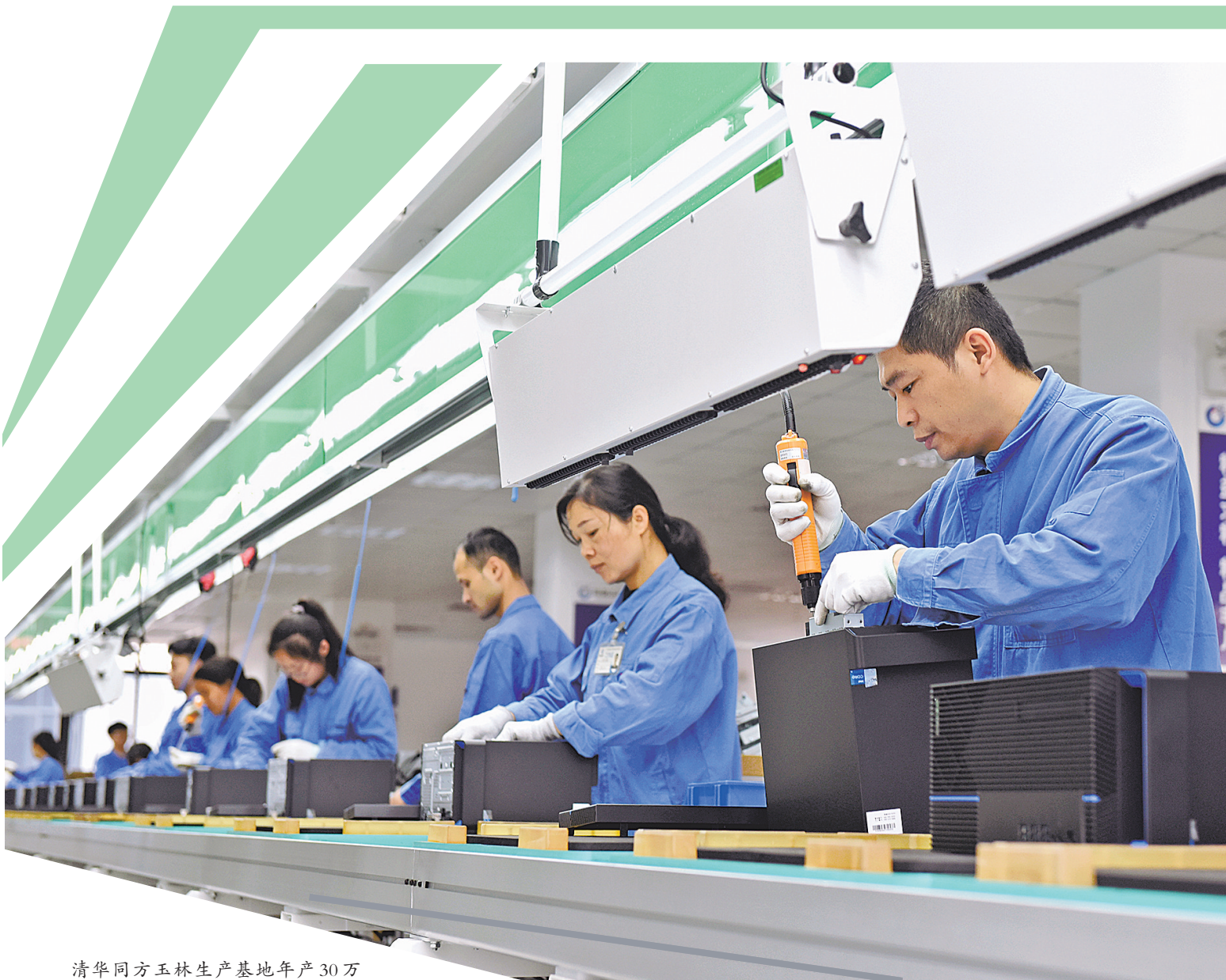
清华同方玉林生产基地年产30万台信创计算机生产线。