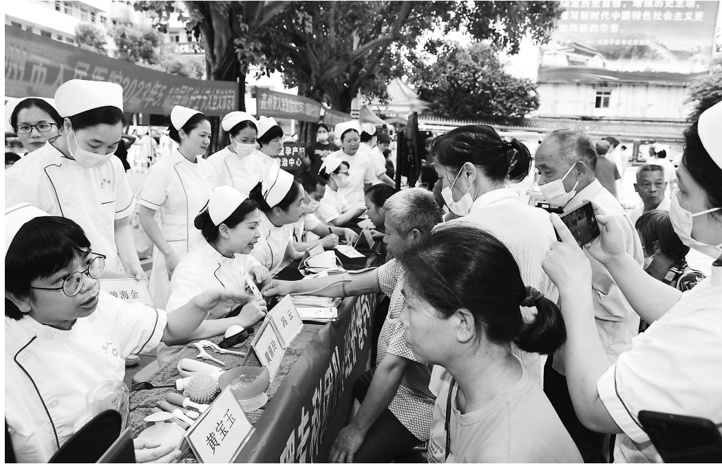
义诊现场。

近日,随着广东省护士协会第二批“名护士工作室”名单公示,该院现已荣获5个名护士工作室,分别为程丽静治疗专科名护士团队工作室、周林荣伤口造口名护士团队工作