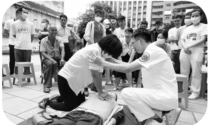
群众纷纷在现场“仿真”教具上体验“实操”急救技能。