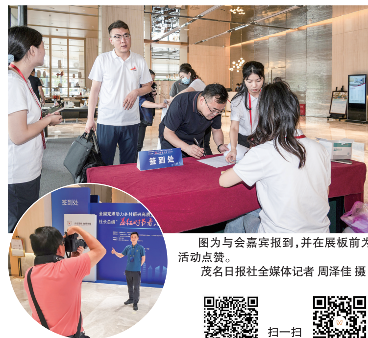
图为与会嘉宾报到,并在展板前为活动点赞。

此外,活动还得到广东海龙阁饼业有限公司、广东伟业罗非鱼良种有限公司大力支持,茂名市茂南茂汉汽车贸易有限公司、广东大为汽车产业股份有限公司为活动提供工作用车。