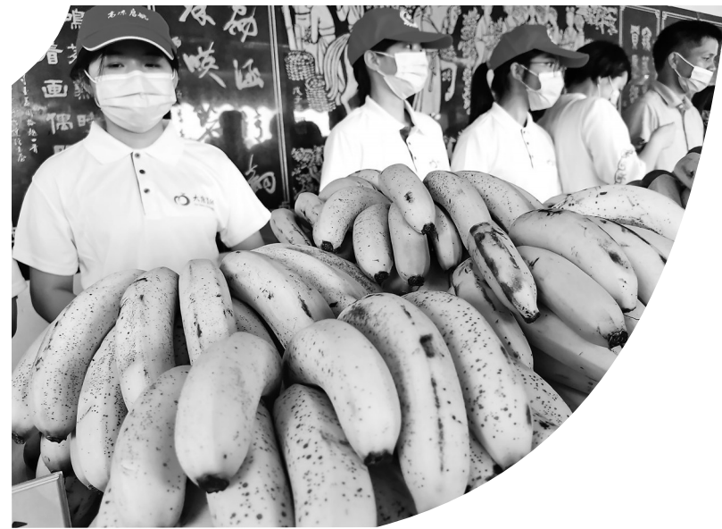
茂名高脚通地蕾香蕉获地理标志保护