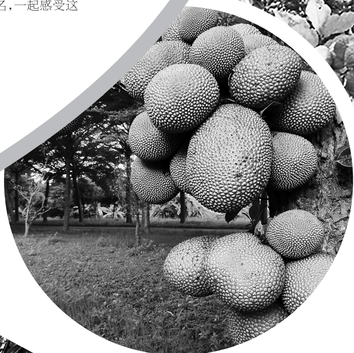
俗称岭南果王的菠萝蜜