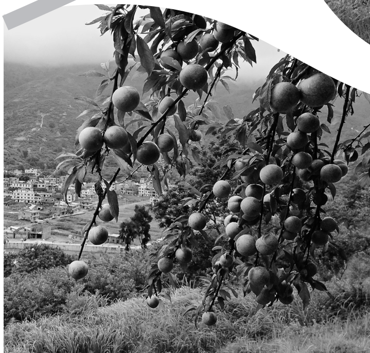
果大汁多的三华李