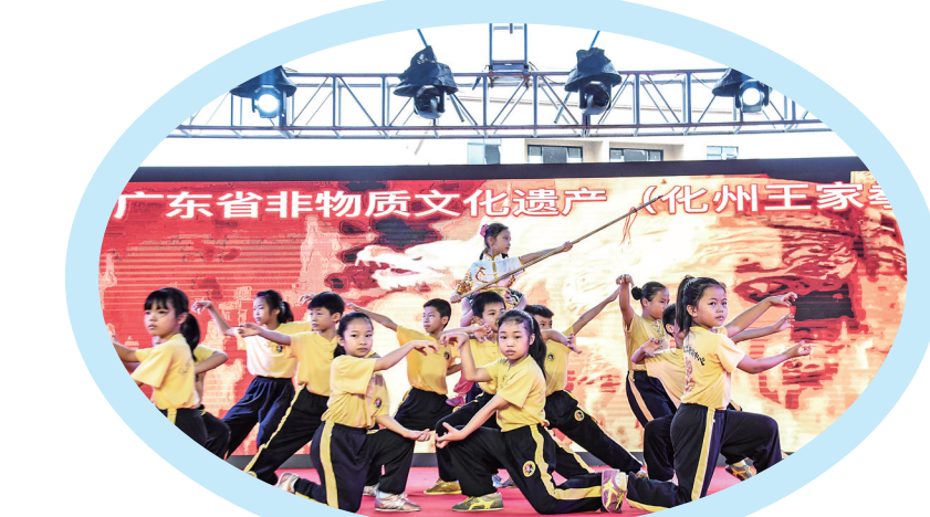
▲化州王家拳《岭南雄风》