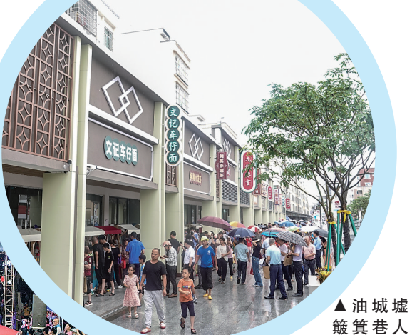
▲油城墟簸箕巷人气十足