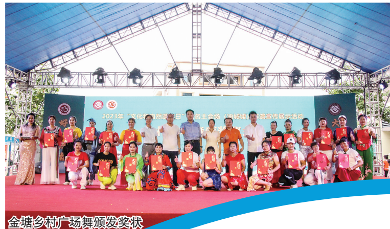
金塘乡村广场舞颁奖状