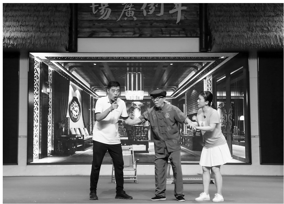
小品表演《父亲的铁皮盒》。

据悉,我市于2016年在全省首创茂名“民生与法治”普法宣传活动,搭建起政府部门与市民群众面对面沟通互联、零距离普法平台。今年,我市打造茂名“民生与法治”助力法治乡村建设法治文艺巡演活动项目,以全新普法模式,打造“好心茂名法治之城”群众性法治文化普法新载体和新品牌,以法治护航茂名市“百县千镇万村高质量发展工程”,持续推动司法行政工作高质量发展,为经济社会发展提供有力的法治保障,进一步提升人民群众的获得感、幸福感、安全感。