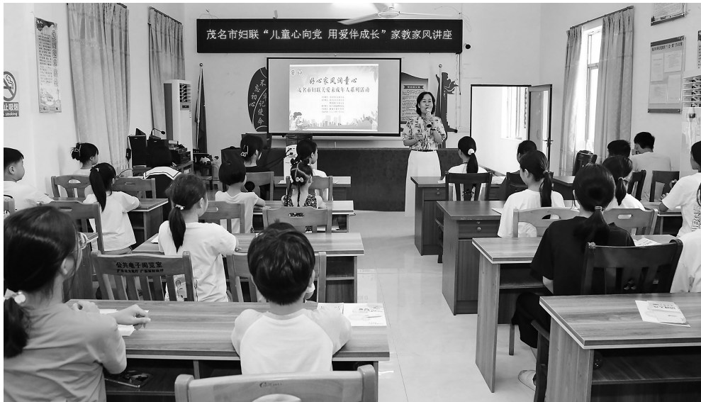
昨日,“儿童心向党 用心伴成长”家教家风讲座在电白区霞洞镇塘涵村举行。