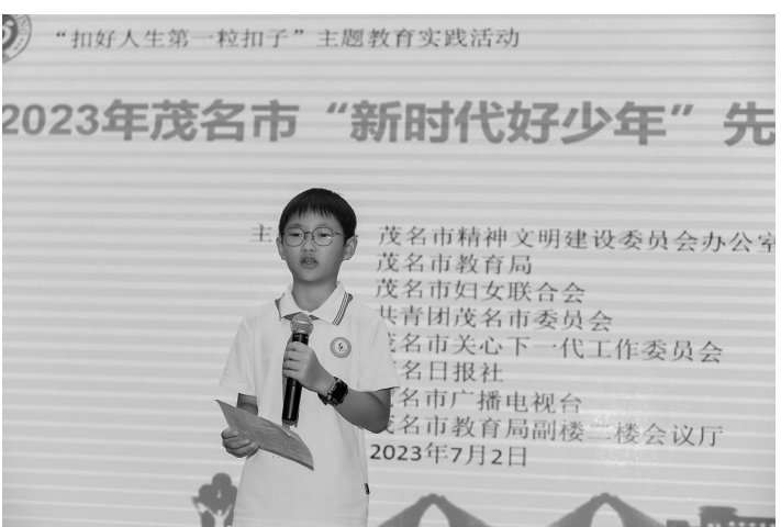
弘扬中华优秀传统文化上树立标杆。下一阶段,相关部门将在全市中小学继续组织开展“新时代好少年”学习宣传活动。

与自豪,更感到责任在肩。在今后的学习和生活中,我将珍惜这份荣誉,并将这份荣誉转化为坚定信心、勇往直前的不竭动力,以一名优秀学生的标准更加严格要求自己。”获奖代表发言完毕后,师生们表演了笙鼓小合奏《赛龙夺锦》、歌曲《我和我的祖国》《精忠报国》、舞蹈《广东省粤韵操》等节目,现场气氛激情澎湃,催人奋进。主办方表示,举办本次活动旨在全面贯彻党的教育方针,落实立德树人根本任务,培养德智体美劳全面发展的社会主义建设者和接班人,希望受表彰的同学珍惜荣誉,刻苦学习,继续在思想品德、学习创新、志愿服务、