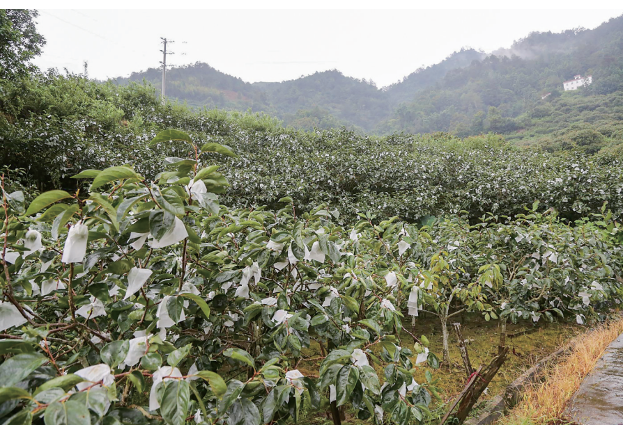
北梭村甜柿基地做好防风措施。茂名日报社全媒体记者 李颜东 摄

能力。目前,大成镇农作物暂无大面积明显受损情况。 临时安置点转移群众生活井然有序 为做好群众的转移安置工作,大成镇第一时间通过网格化管理,积极发动辖区内危险地区的群众到集中安置场所。全镇共转移26户97人,16个安置点均落实责任人,并备有饮用水、食物、生活用品等保障物资。此外,各个安置点对安置人员进行台账登记管理,确保转移安置群众人身安全“不漏一人”。