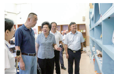
■文/图 通讯员 许来仔 刘海志

本报讯 近日,市关工委主任林日娣率领市关工委、市教育局关工委相关人员到电白区考察全国规范化家长学校实践活动实验区建设工作。电白区委常委、二级调研员刘沅元,区关工委、区教育局、水东街道中心学校、电白一小、占鳌小学等相关负责人参加。