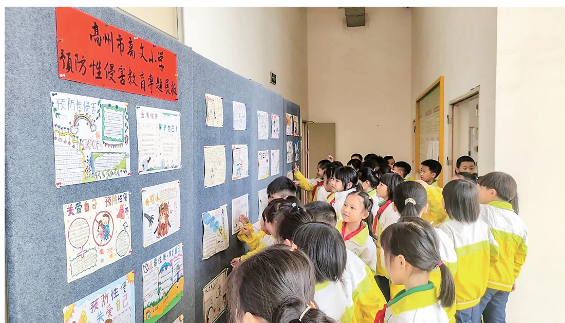
高州市高文小学开展预防性侵害教育。

有些问题是孩子成长中的必经现象,父母应该抓大放小,因为教育孩子不是一朝一夕的事情。父母要去理解孩子,读懂他们的心理需要和愿望。每个孩子都有他的优点和缺点,父母们可以多关注孩子身上优点,多给予肯定,对于孩子积极的想法和做法,父母可以多给予支持和鼓励,帮助孩子学会