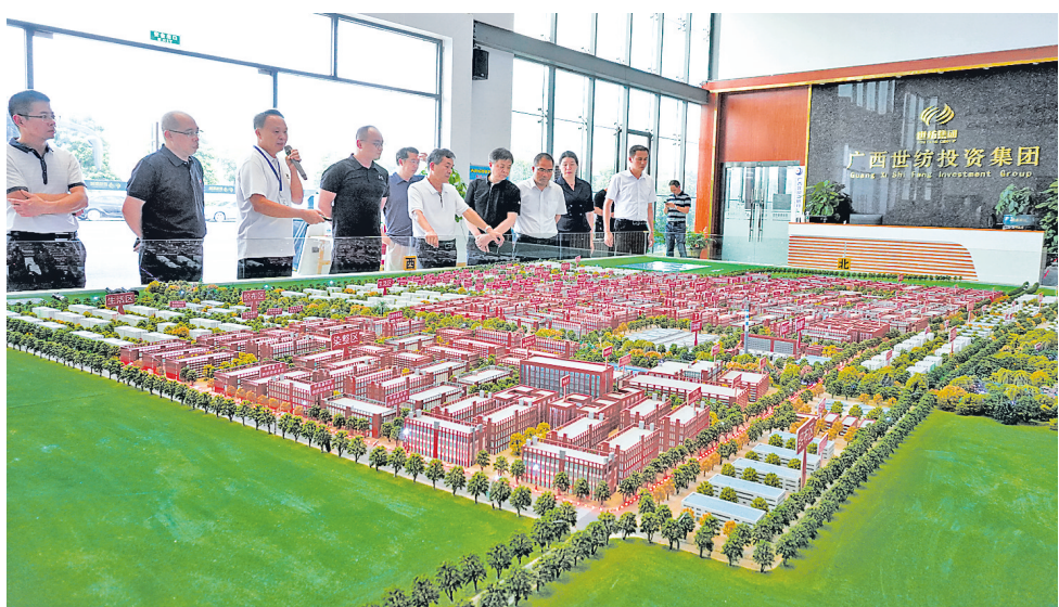
与会嘉宾到中国（贵港）纺织服装新区考察，看产业、看项目、看发展，并就相关主题现场沟通交流。图为嘉宾在广西西纺投资集团考察。