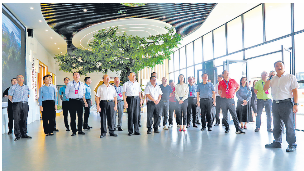
与会嘉宾参观贵港（覃塘）国家绿色家居产业园。

7月30日至31日，2023中国产业转移发展对接活动（广西）高端绿色家居产业专题对接活动暨2023中国家具协会整装和定制专业委员会年会、纺织服装专题对接活动暨纺织服装产业协作交流会在南宁市和贵港市举行，来自全国各地行业专家、企业主对贵港市绿色家居、纺织服装这两个产业发展给予高度赞扬和认可，“好家居贵港产”“好服装贵港秀”声名远播。