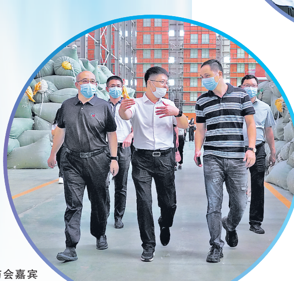
与会嘉宾到位于贵港市港南区的广西桥圩小荷羽绒制品集团有限公司考察。

2023中国产业转移发展对接活动（广西）高端绿色家居产业专题对接活动暨2023中国家具协会整装和定制专业委员会年会吸引了区内外众多媒体的关注。图为7月31日《中国家具报道》总编辑段麒架起两台手机现场直播。