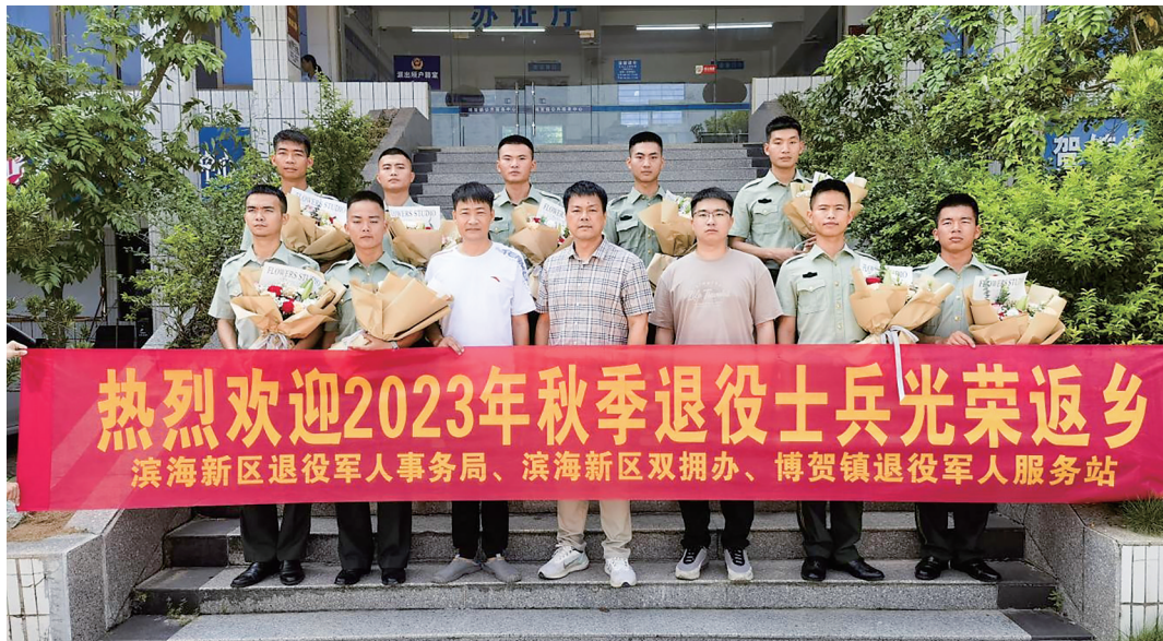
滨海新区退役士兵留影。

正值退役季，化州市退役军人事务局开启2023年度退役士兵返乡报到“一站式”服务，通过集中代力的方式让“数据多跑路、退役士兵少跑腿”，创新服务模式，提高服务水平、解决好“最后一公里”问题，增强广大退役士兵的获得感、幸福感、荣誉感，在全社会营造尊重尊崇退役军人的良好氛围。