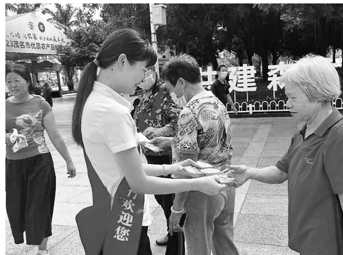
中国农业银行茂名分行在活动现场开展反假币、防诈骗等金融知识宣传活动。

万家”服务理念,积极探索金融服务新模式、新举措、新产品,助力农业产业现代化、农村宜居宜业、