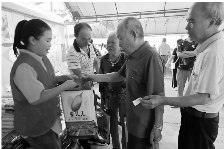
80岁以上老人喜领慰问品。

厕5处，拆除违章建筑15处，废弃猪牛栏、泥砖危房23户总面积1600平方米，生活垃圾实现村收集镇转运，道路硬化率达80%以上，亮化工程100%全覆盖，从干净整洁村升级为美丽宜居村。雨污分流排污系统七条村全覆盖，文明、文章、园子坡、博鉴仔四条自然村自来水旧管网全部更换。为了给老年人提供一个学习、娱乐、休闲、健身的场所，使老年人老有所学、老有所乐、老有所教，让老人们安享幸福晚年，现在正在筹备在德南自然村建设老年人活动室、长者饭堂、党建公园等。