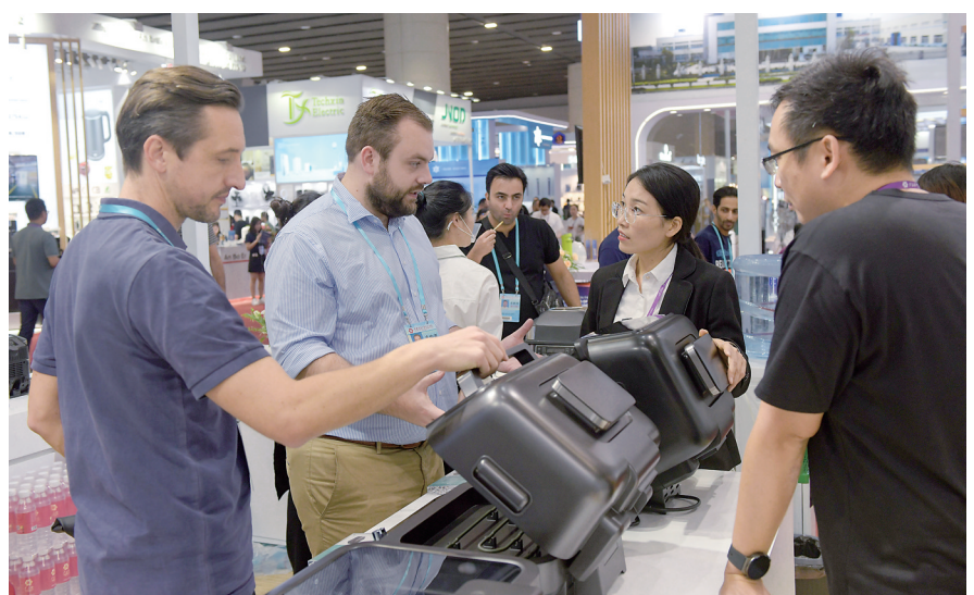
10月15日,客商在广交会上参观、选购。

吸引力源自中国高质量发展的广阔前景。近年来,中国出口商品结构持续优化。作为中国外贸的“晴雨表”和“风向标”,本届广交会第一期重点以先进制造业为支撑,家电、电子消费品、机械设备、新能源等产品展区规模扩大,为更多高技术、高附加值企业提供参展机会;第二、第三期侧重适应消费升级和美好生活需要的产品,为全球采购商一站式采购提供便利。