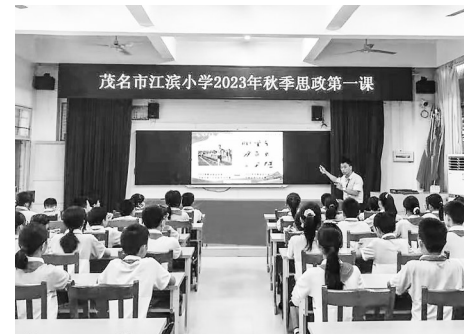
讲好思政课。

思政引领,铸魂育人。茂名市江滨小学将继续探索思政教育新模式,强化思政课建设,不断提高思政课教师队伍整体工作水平,让有信仰的人讲信仰,牢记为党育人、为国育才的教育使命,培养德智体美劳全面发展的社会主义建设者和接班人。