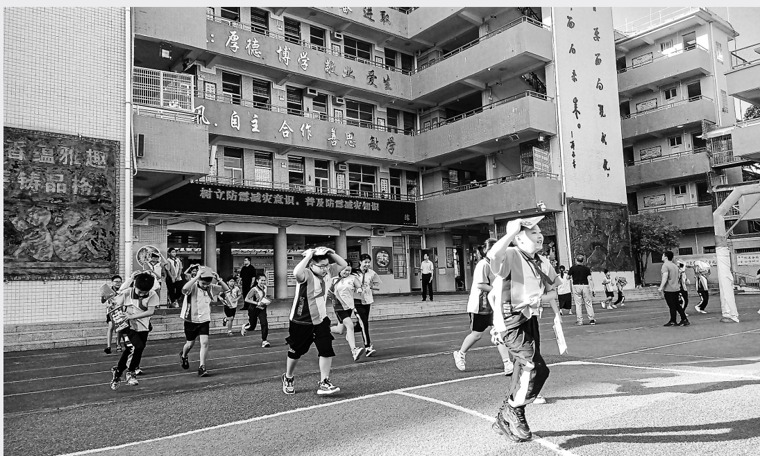
应急疏散演练活动现场。

生命安全重于泰山,通过本次演练,进一步增强了师生的安全意识,让全体师生掌握了逃生、自救基本方法和提高了抵御和应对紧急突发事件的能力。有备则无患,远虑解近忧。创建平安校园,全校师生行动起来,该校将继续开展此类安全教育活动,让安全意识植根在每一位学生的心中。