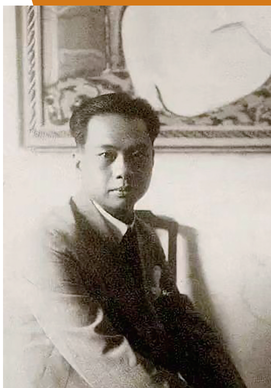
青年时期的丁衍庸

由中共高州市委宣传部指导,高州市文化广电旅游体育局、广东高州中学主办的“意象之美——丁衍庸国画作品展”近日在高州市博物馆开展。此为高州籍国际著名艺术家、美术教育家丁衍庸先生的51件国画作品首次公开展出。据悉丁衍庸先生的这批作品一直保存在其母校高州中学,为其后人和学生捐赠。这批画作的创作时间多为上世纪70年代,已被列为可移动文物。