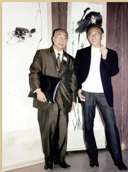
丁衍庸(左)与赵无极在巴黎展览会。