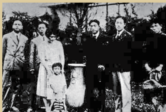
徐悲鸿(右3)、陈抱一(左2)丁衍庸(左1) 1926年摄于上海抱一画室。

“丁衍庸在国际上是挺有名的一个画家,第一次在家乡公开展出的这一批画作是极为珍贵的,在大约十年前,我们就已经留意到了。因为那时国家文物局就制定了一批艺术家的作品限制出境的标准,丁衍庸的艺术精品被列为是不能够出境的。所以一直保存在高州中学的这批艺术精品其实已经达到文物的标准,我们已经把它列为可移动文物了。为了能够让这批文物发挥更大的作用,能够让普通的群众都能够欣赏到,我们举办了这个展览。”高州市博物馆馆长陈冬青说,“同时我们也希望社会各界关注和关注丁衍庸的家乡——高州,让艺术与美育之花在高凉大地盛开,助力高州在新时代文化建设方面实现振兴发展。”