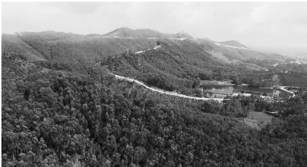
化州全面实施森林质量精准提升行动。

以进出城区高速公路重要节点为重点,并与周边绿色鉴江、罗江画廊和乡村示范带景观提升结合起来,207国道绿化17.5公里,