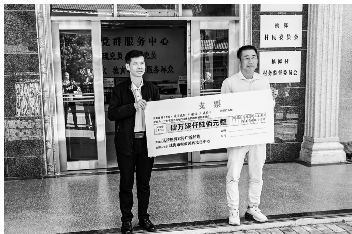
捐赠仪式。

此前,该农场经过驻林头镇工作队和珠海驻茂名电白帮扶工作组的协调推动,福绿康家庭农场去年9月就纳入到珠海市对口帮扶“两个一百”项目库中,获得珠海市产业帮扶资金的支持。值得一提的是,该家