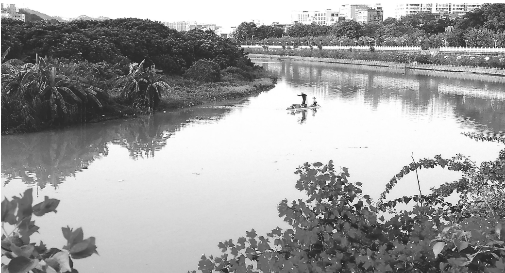
风景如画

这是一座古城。一座跨越了两千多年悠悠岁月的古城。 青砖砌成的城墙,慷慨挺拔,逶迤伸展,完整而又坚实,绵延十多公里,被誉为“我国南方不可多得的完璧”。 登上城楼,远眺,城外,高楼林立,人来车往,一幅现代化都市的画卷在眼前铺开。墙内,古街古巷、亭台楼阁,古代气息与现代时尚相交融,处处散发着生活的淳朴与宁静。 沿着古老的城墙,我慢慢细品。眼前这道历经千年战火和风雨沧桑的城墙依然傲然屹立,虽然它不言语,却能感受到历史的厚重,仿佛时光倒流,又恍若隔世。我触摸着这些久经风霜的青砖,轻闻着久远的硝烟气息,依稀可以见到关云长骑着那匹赤兔马,手握青龙偃月刀,马蹄碰撞青砖发出“喀喀”声响,在城墙上扬起一阵阵烟尘。绕着古城墙走一圈,每块青砖都在诉说着那个鼓角争鸣的时代故事,在这里,你可以重拾年少时有过的英雄豪情。 城墙内侧,是一面土墙,陡峭,墙顶部足有三米多宽。不少地段的护城上都栽着柏树,枝叶扶疏,远远望去,古城墙就成了一道绿色的屏障。 城墙外围,是护城河,是进入古城的第一道防线。河水绕古城款款而流,外接浩渺的汉水,碧水长流,杨柳婀娜,烟波缭绕。两千多年来,这水波荡漾的护城河严严实实地将古城与城外分隔开,守护着古城的安宁。 据载,古城墙始建于春秋战国时期,几经战乱摧毁,现存城墙是明清时期修缮。城墙共六座城门,每座城门都设有瓮城,只有品读瓮城,才能深刻理解“瓮中捉鳖”的真正含义。 在城门上方的垛口旁,挂着镏金的