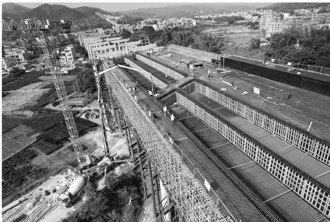
施工现场。

阳信高速公路北界大桥全长约947m,其中第3#~6#跨需上跨西江河、西江大道。西江河水面宽约45m,汛期水位上涨快,排洪量大,设计为一联(46+48m)现浇箱梁,采用梁柱式支架+满堂支架现浇。因桥跨位于曲线段,混凝土浇筑方量较大,断面结构不规则,汽车泵送混凝土出料冲击