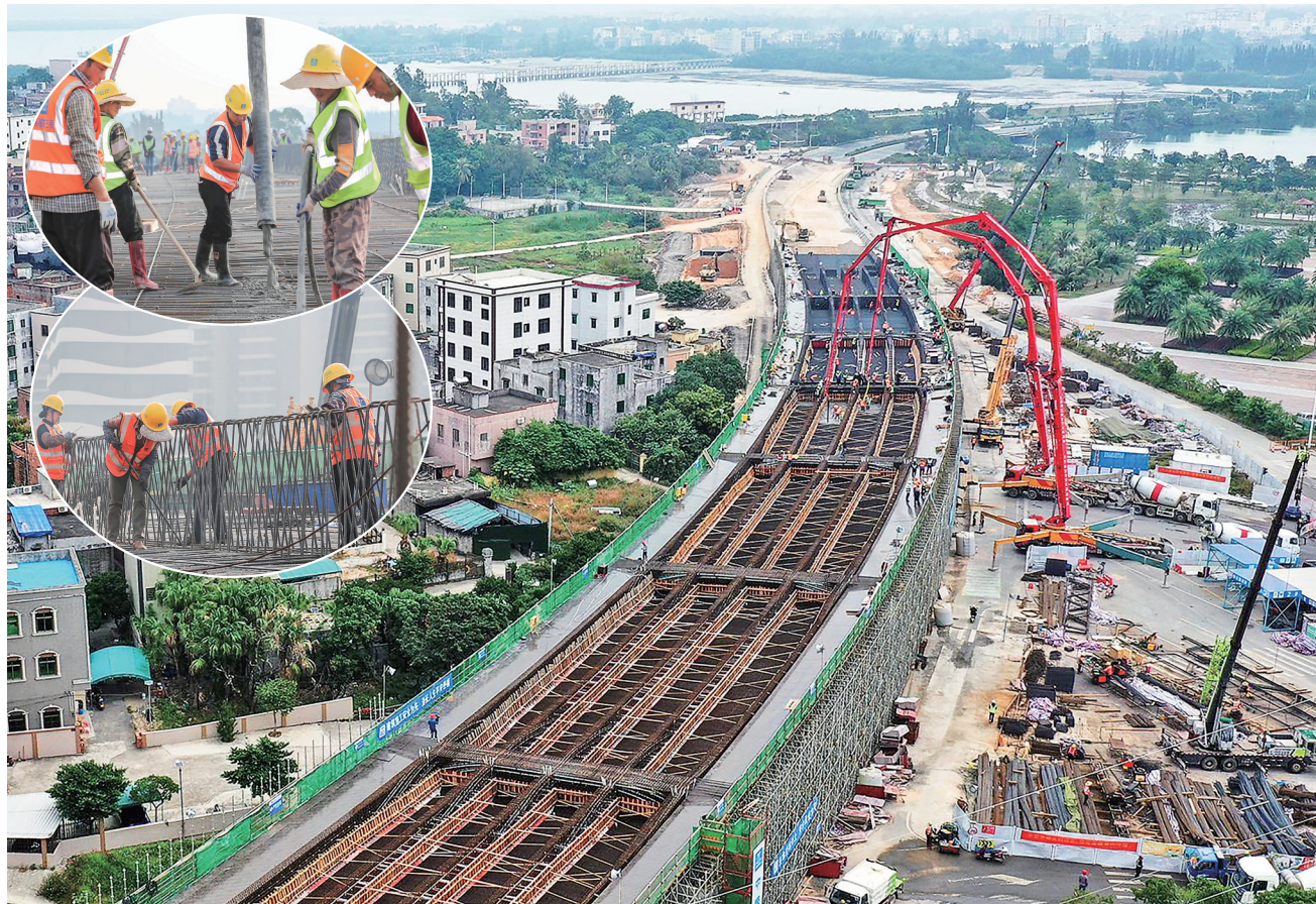
海洋大道立交箱梁建设施工现场。

据统计，海洋大道立交项目已完成路基挖填方91%、引桥挡墙完成100%、桥梁下部结构100%、桥梁上部结构50%、涵洞工程100%。项目建成通车后，行车方式由平面交通改为立体交通，将有效缓解道路局部交通拥堵，极大提升茂名主城区至滨海的通行效率。