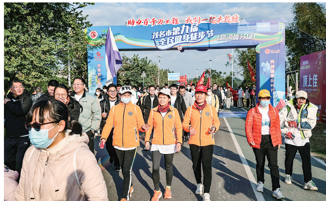
我市举办全民健身徒步节，组织市民“趁高凉墟”体验洗夫人文化，感受深厚的历史底蕴。

在电视剧方面，我市推出的《谯国夫人》（别名《巾帼传奇》《洗夫人传奇》）2023年在央视首播，受到了观众的热烈欢迎，收视率在全国名列前茅。该剧以