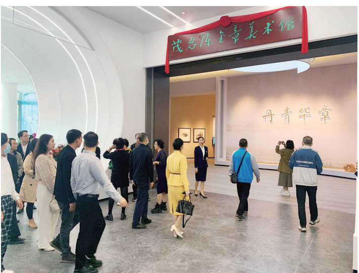
茂名陈金章美术馆开馆首日吸引众多市民前来参观。

区博物馆、艺术中心融合一起,项目投资总估算约1.6亿元,总建筑面积约为11873平方米,打造一个国际级的艺术殿堂。“浓浓文化味”和“满满烟火气”交织碰撞,纵横交错间,新的文化中