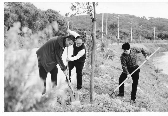
根子镇与该镇商会成员共建“乡贤林”。

根子镇以此为契机,因势利导,通过悬挂横幅、制作宣传栏、“村村通”广播、开设微信工作群、在各村党员群、老乡群中定期推送全镇植绿迎春的做法成效,广泛深入开展多层面的宣传工作,倡导全体村民发挥主人翁精神,在自家门前屋后的闲置土地自建,或与邻里共建小绿地、小花园、小菜园。目前,村民在近半个月来投工投