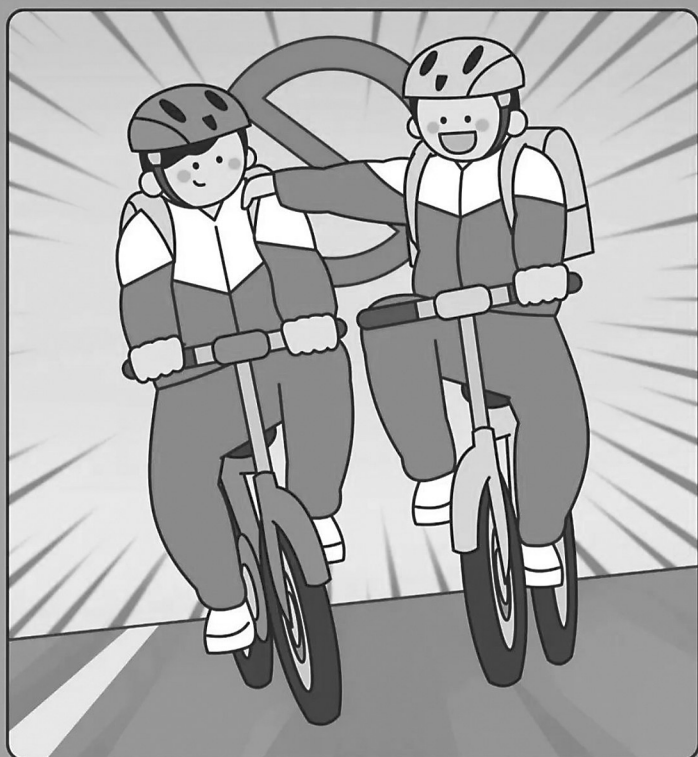
公安部交通管理局 教育部基础教育司