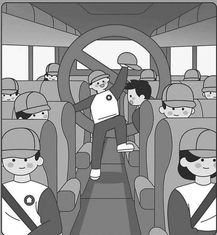
公安部交通管理局 教育部基础教育司