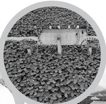
乡村美景荷塘湿地。