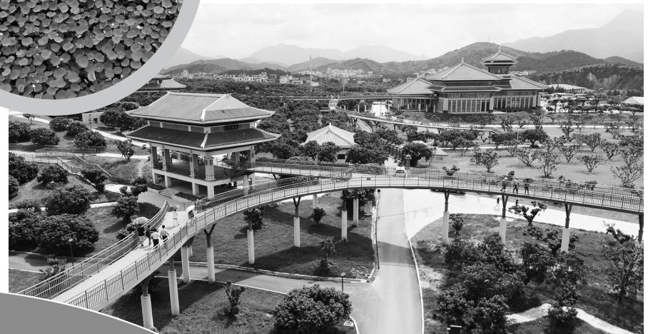
高州市根子镇荔枝博览馆。