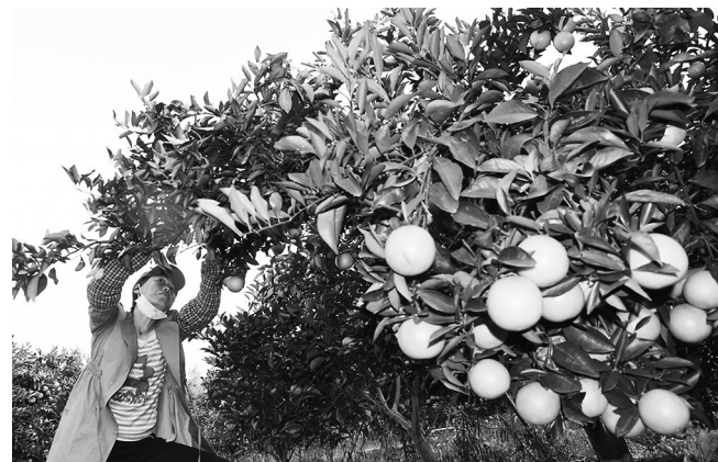
橙“意”满满,喜迎丰收。