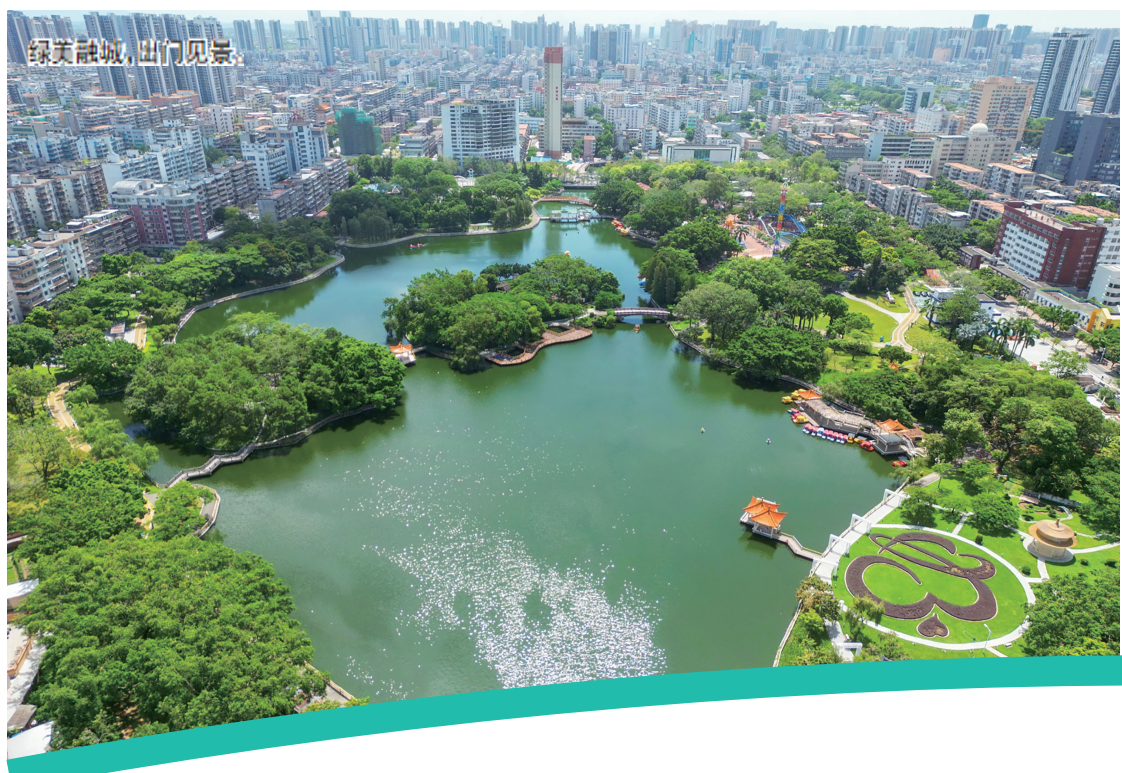
绿美新城,出门见景。