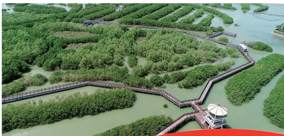
海上栈道,湿地成林。