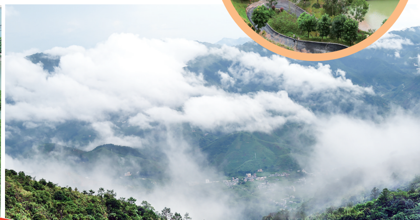
云雾缭绕,绿藏其中。