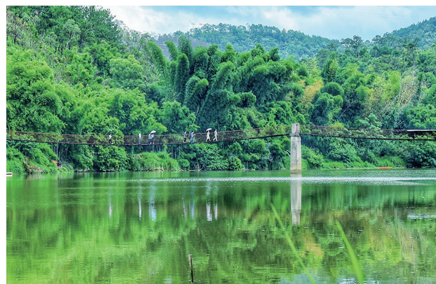
绿水青山,人游于画。