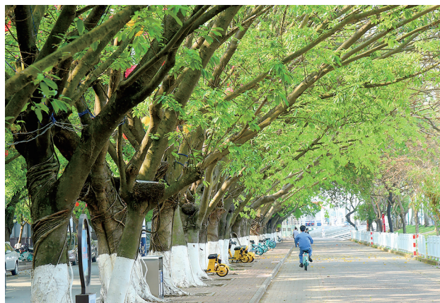
林荫大道,悠然自得。

值得一提的是,我市将林分优化、县镇村绿化任务分解到县、镇、村,各地及时将任务落实到具体地块,用地落实率100%。苗木保障是造林绿化的重要基础,重点围绕“种什么树”,遵循尊重客观实际和群众意愿科学选取树种,城乡绿化苗木以沉香、油茶、化橘红等林业特色经济林和大叶相思、楠木、铁冬青等绿化树为主,同时加强苗木储备基地建设,深入贯彻落实“绿水青山就是金山银山”的生态理念,让环境美起来的同时,也让村民的收入提起来。