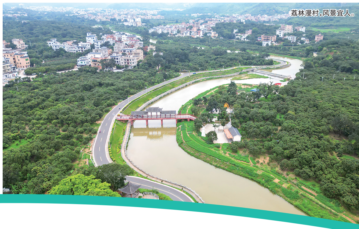
荔林漫村,风景宜人。

“我扶着树苗,你来填土!”“大家一起加把劲,把水浇足!”……4月初,茂名滨海新区党工委组织人事部、广东石油化工学院发展规划部(研究生部)、电城镇党员干部在电城镇庄山联合开展义务植树活动,种下一片“校地共建林”。