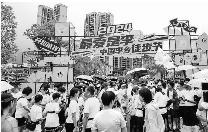
“享李季”之“最爱是李”万人徒步活动。

区,音乐表演、文创展示、烟花展演等各种活动接连不断,整个“享李季”活动好戏连场,高潮迭起,氛围拉满。