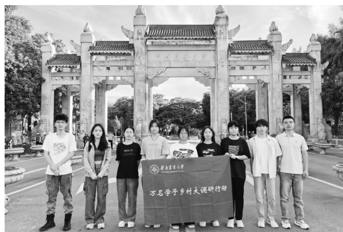
绿野青梦队活动合照。

华南农业大学绿野青梦队在新宝镇的“三下乡”社会实践活动中,通过深入调研和实地考察,不仅增进了对乡村发展现状