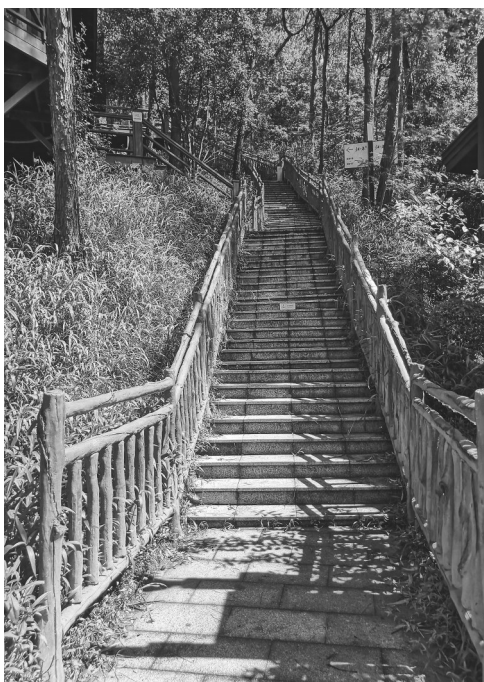
山中栈道

八一,是浩气清风 轻轻吹亮满天英雄的名字 八一,是绿色国防 以使命,守护960万平方公里的和平 以天职,捍卫共产主义的理想与宏图 八一,国家的脊梁 扛起一个强军梦与日月同辉