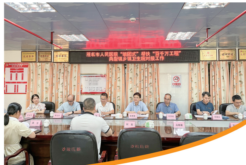
茂名市人民医院“组团式”帮扶“百千万工程”典型镇卫生院对接工作。

每一项荣誉的获得，每一个技术的突破，每一位医生的成长，每一位病人的康复，不仅是茂名市人民医院“智慧医院”建设、医疗创新能力以及综合能力实现高质量发展的体现，同时也彰显了医院在发挥区域医疗辐射引领作用、为广大群众提供优质高效医疗服务的积极作用。茂名市人民医院将继续秉承创新驱动的发展战略，持续深化医疗改革，构建更加完善的医疗服务以及管理体系，同时加快推进智慧医院建设步伐，不断优化就医流程，提升诊疗效率，力求在医院高质量发展上实现新的飞跃，为人民群众的健康福祉作出更大的贡献。