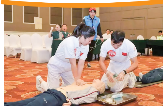
在心胸血管麻醉学会(CSCTVA)第三届全国心肺复苏技能竞赛全国总决赛中获团队二等奖。

“我院要借助好广东省人民医院的资源优势和品牌效应，学习引进先进的管理经验，不断深化巩固高水平医院建设成果，全方位推动医院新一轮发展。”陈赞雄表示，医院把党建工作融入医疗业务工作中，以高质量党建引领高质量发展；同时强化化学科建设和人才培养，在打造重点专科学科、攻克新技术新项目上创特色。