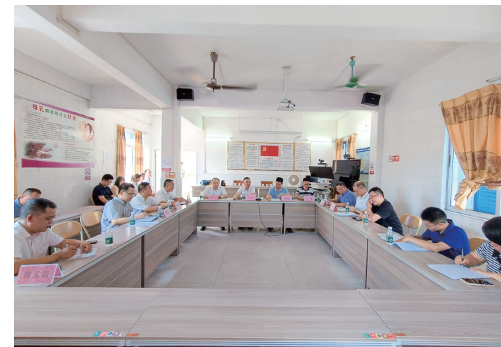
举行“百千万工程”重点工作推进情况专题调研座谈会。

近年来，茂名市人民医院对标国家和省级高质量发展具体要求，不断加大临床重点专科建设力度，目前有神经内科、消化内科、心血管内科、重症医学科、康复医学科和耳鼻喉科等6个广东省临床重点专科，肿瘤科、感染科等2个广东省重点扶持建设临床专科。在国家卫生健康委卒中防治百万减残工程专家委员会公布的2月全国624家三级医院高级卒中中心排名中，医院卒中中心建设成绩以及多项技术质量管理情况排名在广东省乃至全国位于前列：介入取栓技术位居全省第2名、全国第26名，动脉瘤栓塞或夹闭技术居全国第51名，卒中中心总体综合质量管理排名位列全国百强。医院通过国家皮肤与免疫疾病临床医学研究中心(北京大学第一医院)授牌认证，正式成为全国第六批银屑病规范化诊疗中心，目前是茂名地区唯一一家国家银屑病规范化诊疗中心；胃肠外科二区通过评审并获批“规范化外科营养诊疗示范病房”荣誉称号；是华南地区首批荣获“中国晚期乳腺癌PRO全国优秀实践中心”的医院之一；启用粤西首个公立医院核素治疗病房。