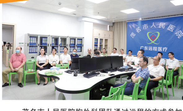
茂名市人民医院胸外科团队通过远程的方式参加了广东省人民医院、广东省肺癌研究所每周三下午的肺癌多学科团队(MDT)讨论会议。