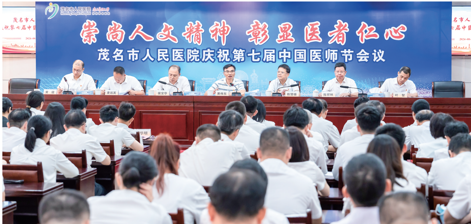
庆祝医师节会议现场。