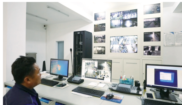
罗牛山冷链物流园监控中心。

在软件管理方面,OCP订单协同系统、WMS仓储管理系统、TMS物流配送系统一键无缝对接,不仅满足仓库管理快速准确实时要求,同时进一步确保了仓配运的高效准确运转。