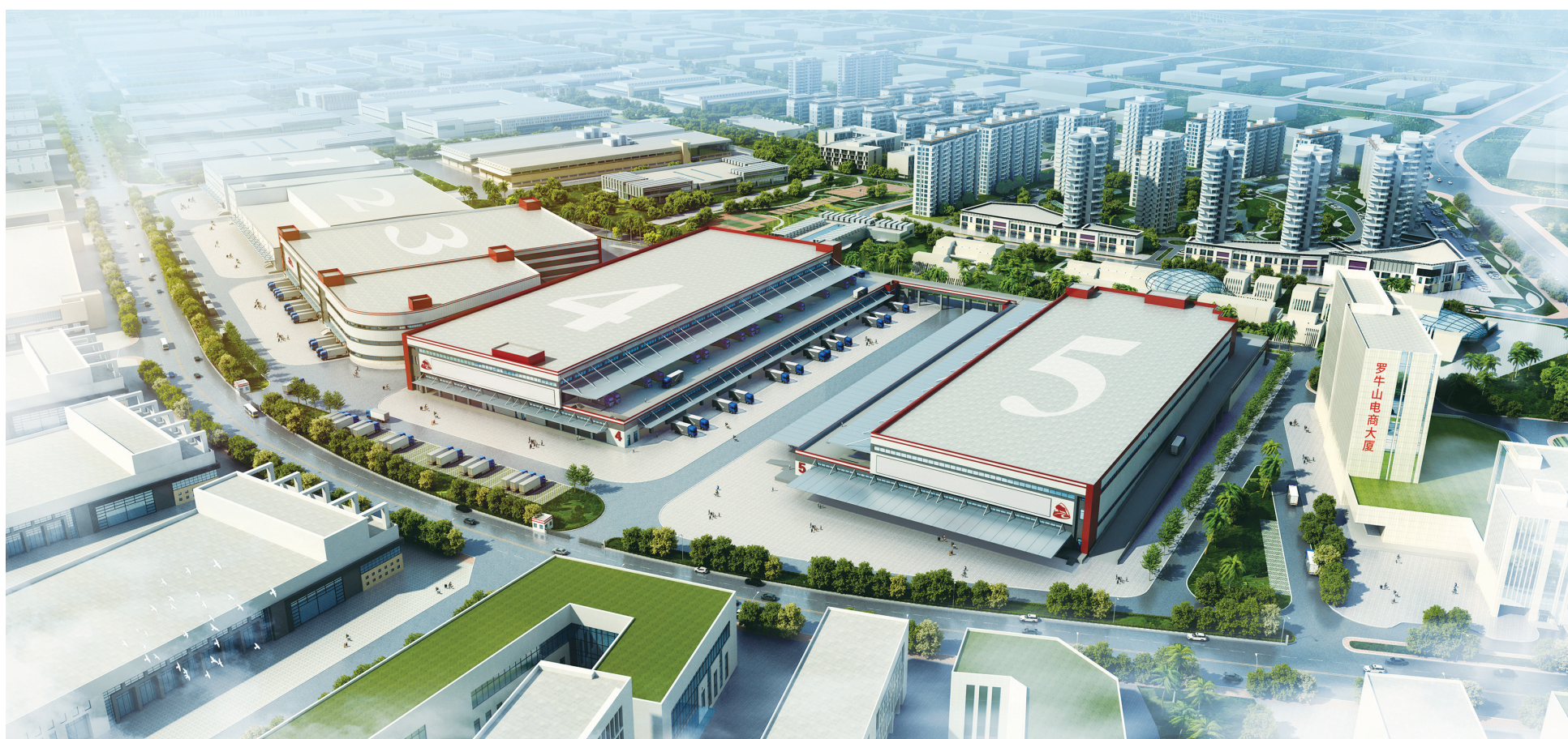
罗牛山冷链物流园鸟瞰效果图。