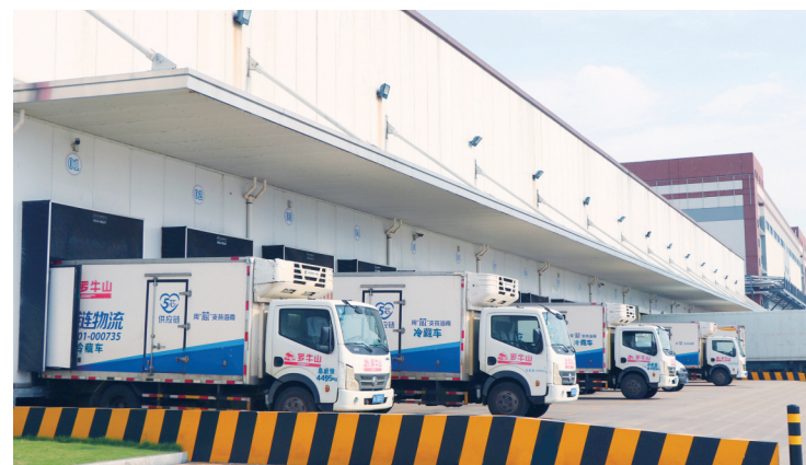
罗牛山冷链物流园运输车队。

此外,罗牛山冷链物流园还提供一系列增值服务,包括货物保险、包装、贴标、分拣、质检等。这些服务旨在满足客户多样化的业务需求,助力企业降低仓配成本,提高市场竞争力。