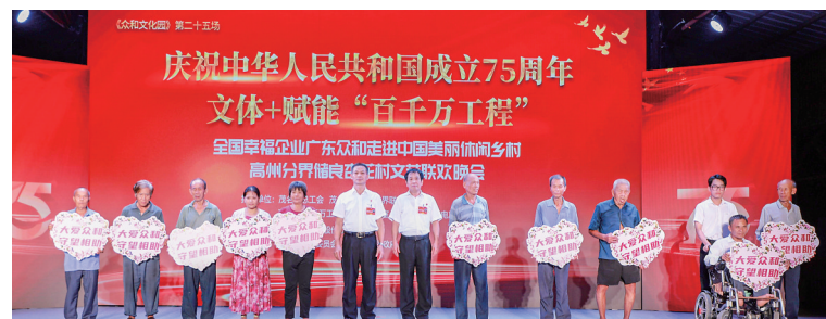
众和公司帮扶困难群众仪式。