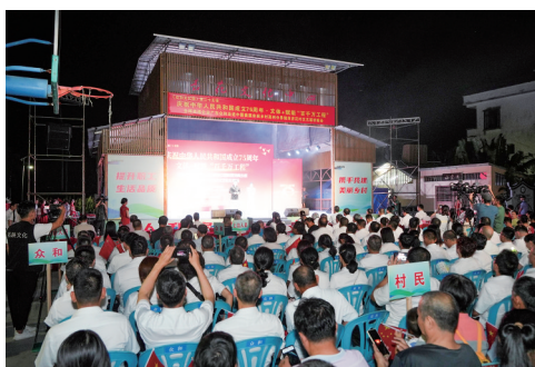
现场观众热情满满。