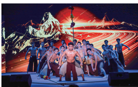
高州市分界中学舞蹈《行鼓行》。