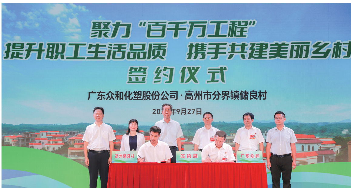
众和公司与高州市分界镇签订共建美丽乡村仪式。

据悉,本次活动由广东众和化塑股份公司(以下简称“众和公司”)、中共分界镇委员会和分界镇人民政府主办,是落实省委、市委的部署要求,汇聚文化力量为“百千万工程”注入新动能,进一步激发了村企合作共促乡村发展的无限可能。