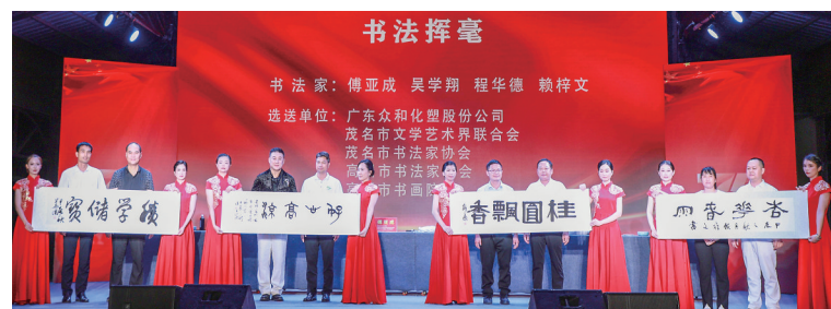
四位书法家现场挥毫,将书法作品分别赠予高州市“百千万工程”指挥部办公室、分界镇、储良村、杏花村。